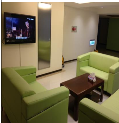
亞東宿舍 房型及設施