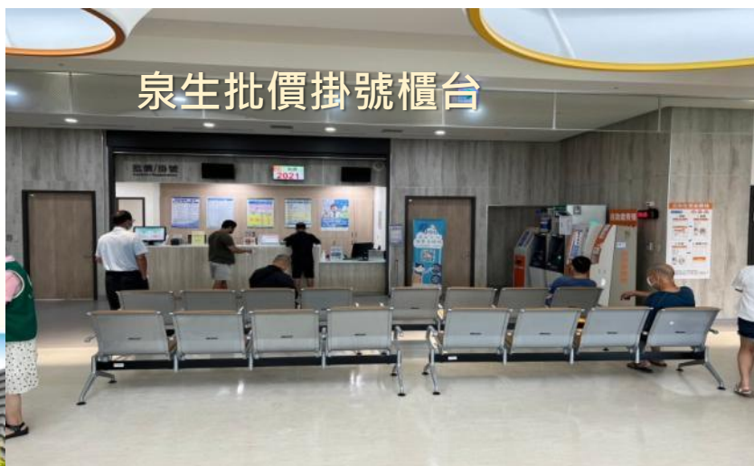
泉生批價掛號櫃台