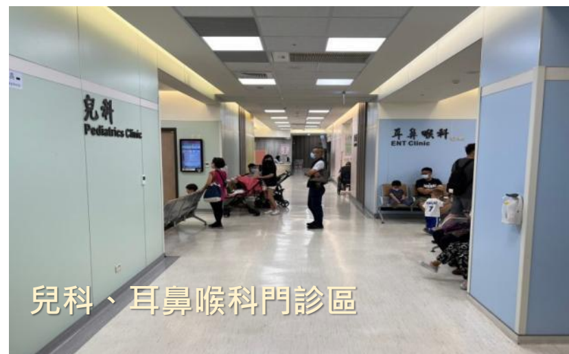
兒科、耳鼻喉科門診區