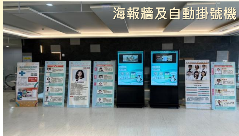
海報牆及自動掛號機