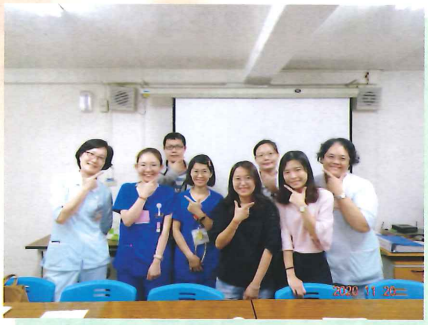
愛在新光燦爛時~新進人員支持團體