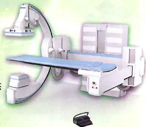
▶血管攝影X光機-提供緊急外傷手術及緊急血管攝影