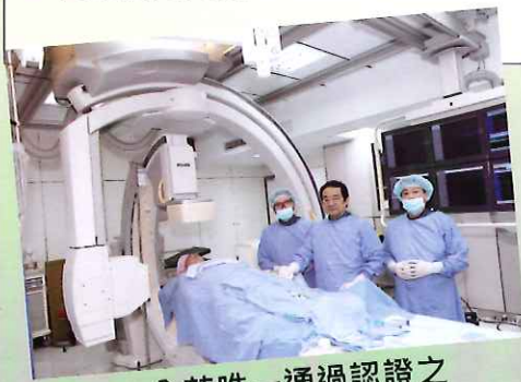
▲全苗唯一通過認證之心血管照護中心