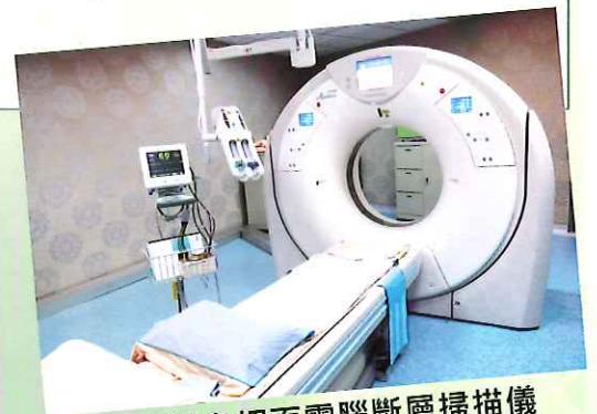
▲高速多切面電腦斷層掃描儀