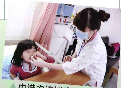
▲中港次流域唯一24小時兒科及婦產科專科服務