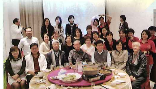
▲醫護主管聯誼活動