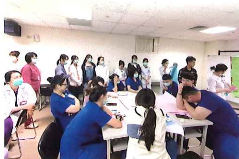
▲新人感恩物語茶會