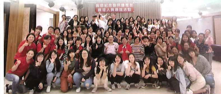
▲基層護理人員聯誼活動

本院科別完整、教育訓練多元、品質促進嚴謹、 薪資福利優渥，絕對是您護理生涯的最佳選擇。