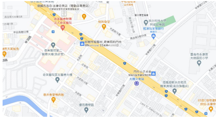
圖二：搭乘高鐵：公車接駁 H62

高鐵台南站(接駁車時刻表) http://busmap.tainan.gov.tw/ebus/pathInfo.jsp?pathId=10265