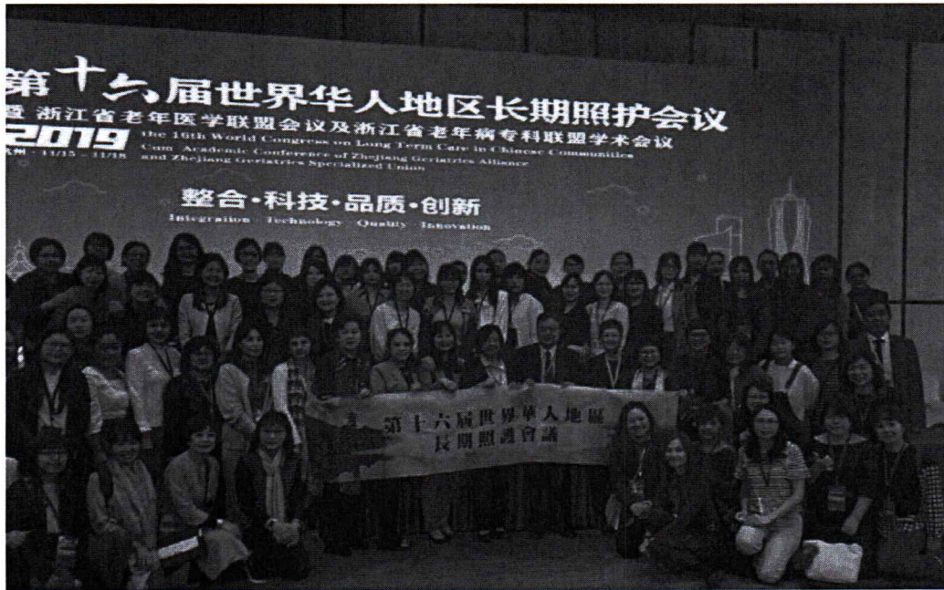
台灣參加者超過百人參加