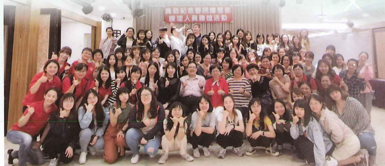
▲ 基層護理人員聯誼活動

本院科別完整、教育訓練多元、品質促進嚴謹、 薪資福利優渥，絕對是您護理生涯的最佳選擇。