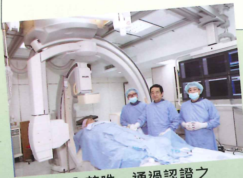
▲全苗唯一通過認證之心血管照護中心