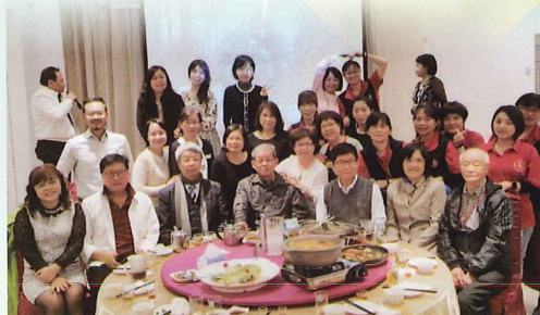
▲ 醫護主管聯誼活動