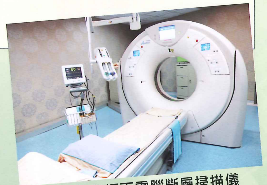
▲高速多切面電腦斷層掃描儀