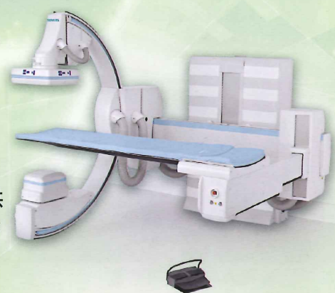
▶血管攝影X光機-提供緊急外傷手術及緊急血管攝影