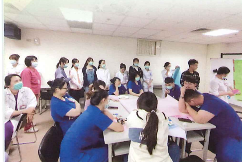
▲ 新人感恩物語茶會