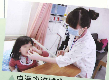
▲中港次流域唯一24小時兒科及婦產科專科服務